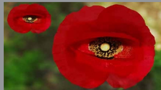
심학산 꽃축제 양귀비

여름날 신록이 싱그러운 심학산에서 시간별로 바뀌는 그림자를 밟으면서 아름다움을 느끼는 것도 인생의 깊이를 알아 가는 한 방법일 것이다.