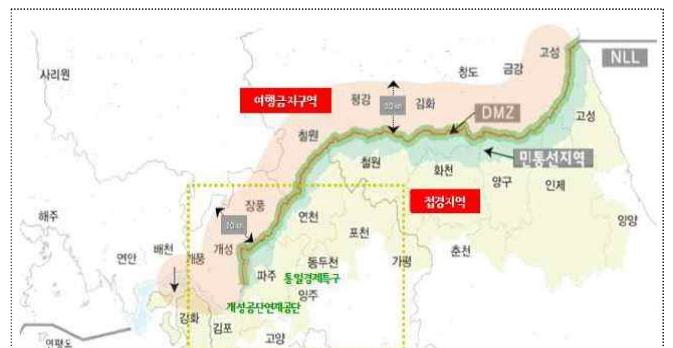
DMZ 및 접경지역(경기연구원)