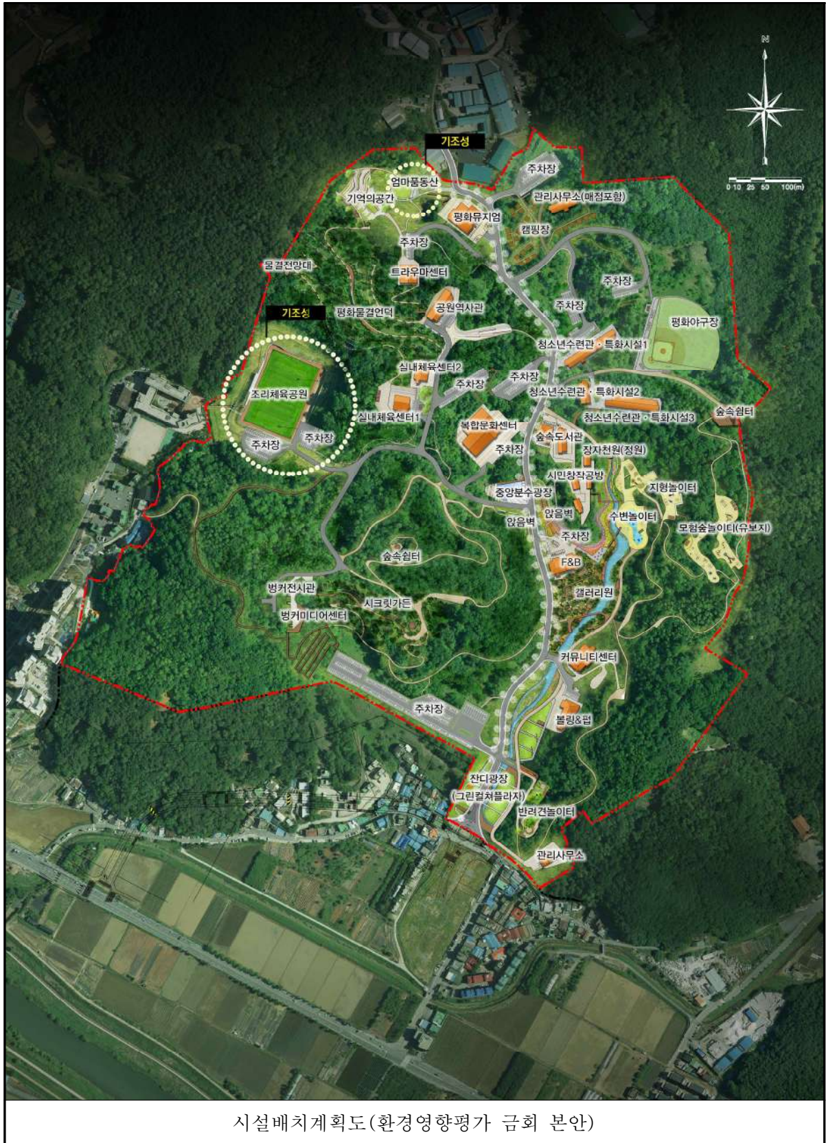
시설배치계획도(환경영향평가 금회 본안)