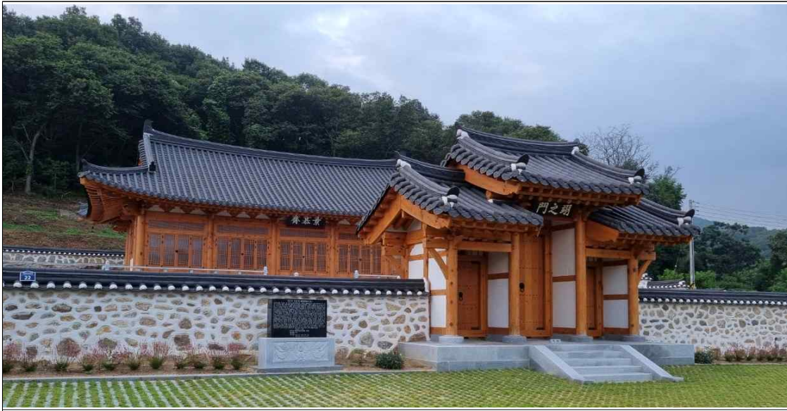
조원과 옥봉의 신주가 모셔진 임천 조씨 군자감정파 사당의 모습. 2020년 완공

그런 일들이 진행되려면 돈이 만만치 않게 들어가는데 신기한 일들이 일어나는 것도 지켜보았다. 도로가 나면서 보상을 받은 것으로 묘역정비를 하고, 군부대에서 오랜 기간 무료로 활용하던 사격장에 대한 사용료를 내겠다고 하며 엄청 큰 목돈이 들어왔다는 것이다. 작은 사당이 있었지만 한옥으로 된 사당을 새로 짓는다는 건 엄두를 못 내던 일이었는데, 옥봉의 묘단을 만들고 합사를 하면서 모든 일들이 준비라도 된 듯 술술 풀리더라는 것이다.