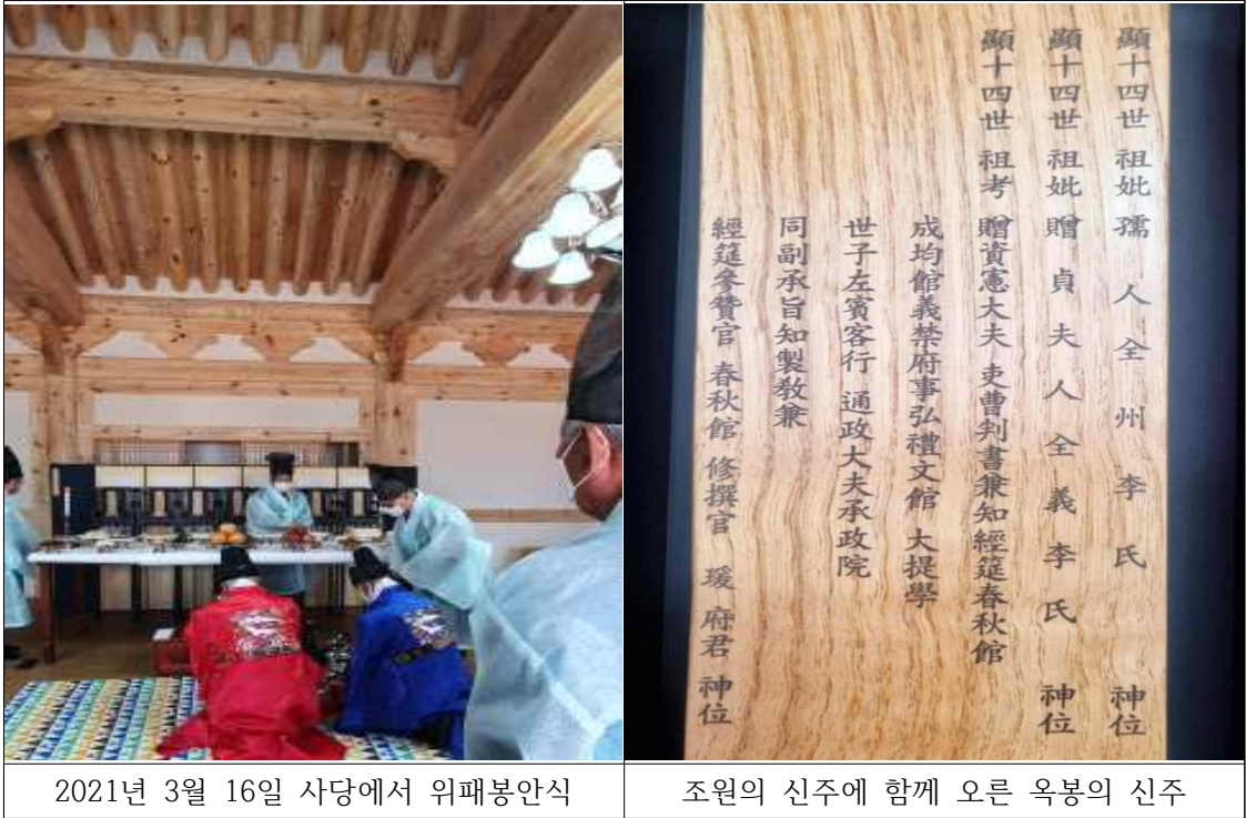
2021년 3월 16일 사당에서 위패봉안식