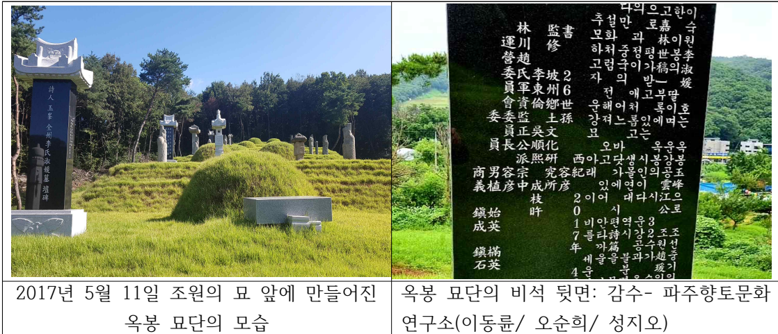
2017년 5월 11일 조원의 묘 앞에 만들어진 옥봉 묘단의 모습