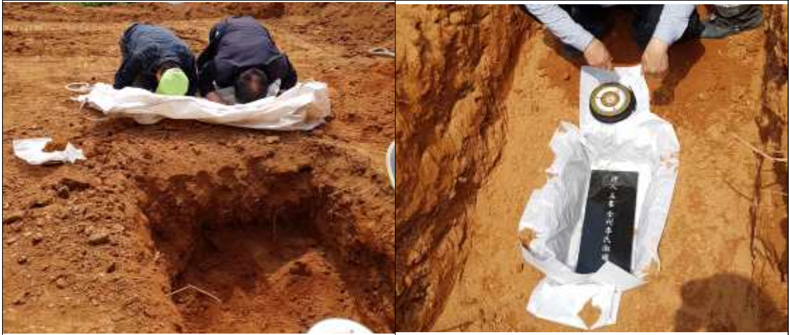
봉분을 만들기 전 절을 하고